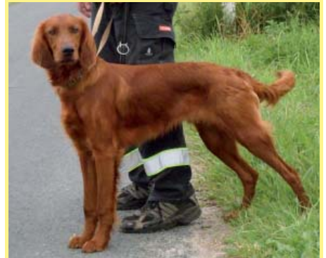
En spændende IS hvalp købt i Norge.

Aldo, der er rundet af, Rosendales, Havdrup, Englyst og ikke mindst Moanruad blod gennem Tysk Von Royal, havde inden sin afrejse til Norge, flere flotte placeringer i vinderklasser. Et spændende køb, som vi gælder os til at se, på marken til foråret.